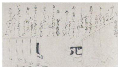
時代不同歌合絵巻断簡 斎宮女御・式子内親王(当館蔵)

中世の斎宮は、斎王制度の衰退・廃絶期とされ、あまり注目されてきませんでした。源平の争乱を経て鎌倉幕府が成立するなど、激動の時代であった中世における斎王制度の様相と廃絶にいたる要因を斎王たちの動向とともに探ります。