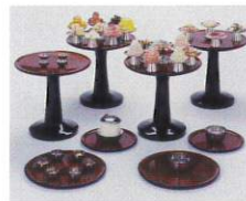
斎王の食事(模型・当館蔵)

常設展示室のトピックを掘り下げるシリーズの第4弾です。今回は、斎王をはじめ、平安時代の人々はいつ、どんな時にどんなものを食べていたのか、記録や絵画資料などから紹介する企画です。