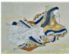
▲三十六歌仙図画帖より 中務(当館蔵)

斎王をはじめとする平安時代の姫君たちはどのような服装をしていたのでしょうか？目まぐるしく変わる現代のファッションのトレンドのように、古代の人々もおしゃれを楽しんだのでしょうか？古代の衣装や、装いのための道具類により、当時の人々が「よそおう」ことをどのようにとらえていたかなどについて紹介します。