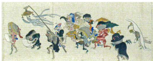
百鬼夜行絵巻▶ (当館蔵)

いにしへの時代から人々を悩まし続けた人知を超える現象や不可思議な力。災いをもたらすとも、神の使いとも考えられていた闇の中に存在する不可思議な者たち。人々は闇の中に何を見たのか。斎宮を取り巻く社会環境や風俗を紹介します。